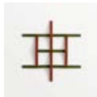
Adagio Rosso + Verde