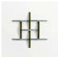
Adagio Grigio + Verde