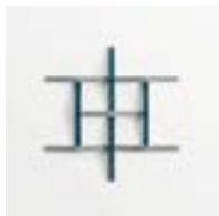
Adagio Grigio + Blu