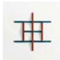
Adagio Rosso + Blu