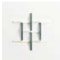
Adagio Grigio + Bianco